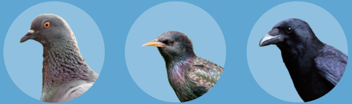
ハト・ムクドリ・カラスなどが嫌がる超音波