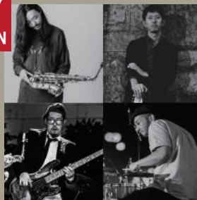
野良犬カルテット